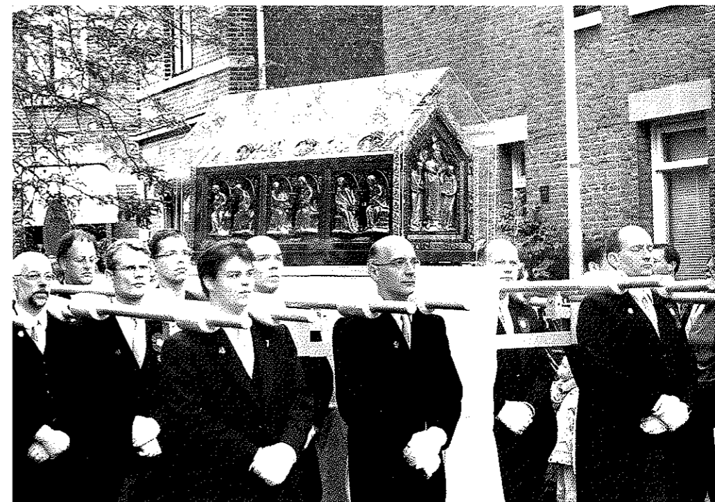
De noodkist waaromheen in de 14de eeuw de Heiligdomsvaart ontstond.

Kijk voor meer info op www.heiligdomsvaartmaastricht.nl