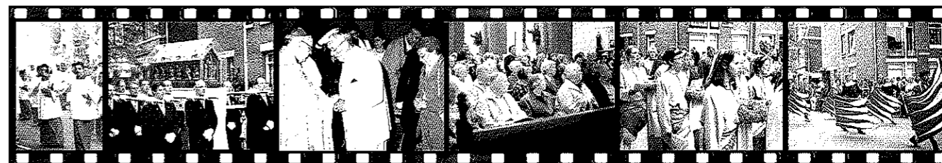
Een filmstrook impressie van de Heiligdomsvaart zeven jaar geleden