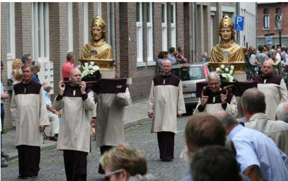
Reliekschrijnen van de Maastrichtse bisschoppen Monulphus en Gondulphus.