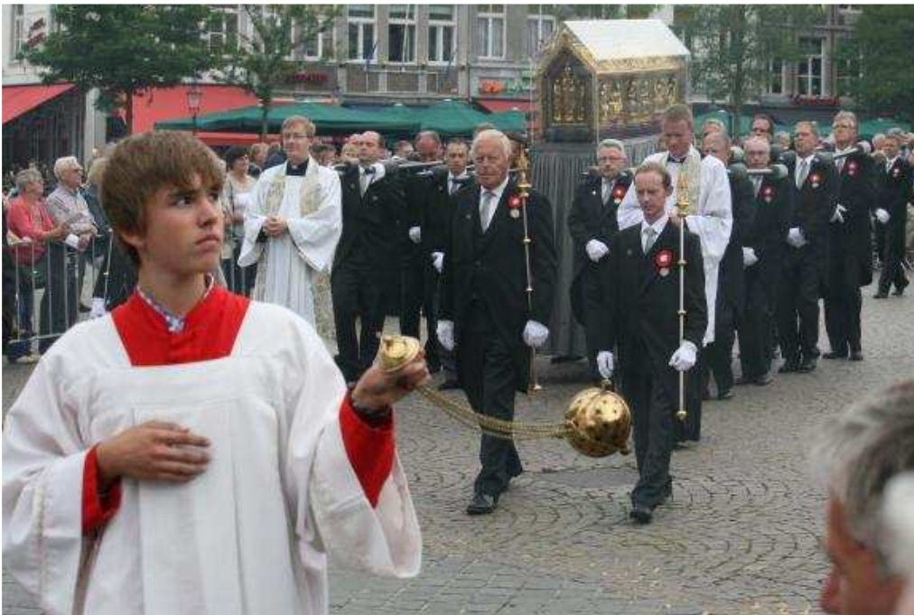
De Noodkist, gedragen door de broederschap van St. Servaas.