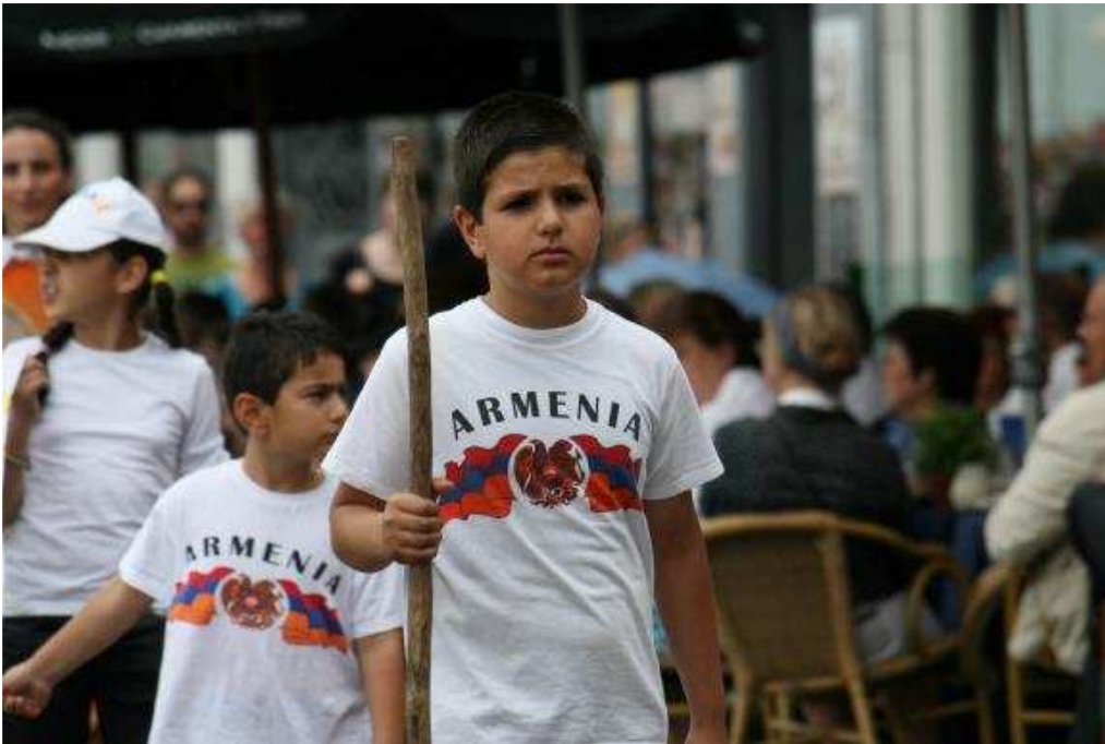
Pelgrimage van Armeense christenen in Nederland.