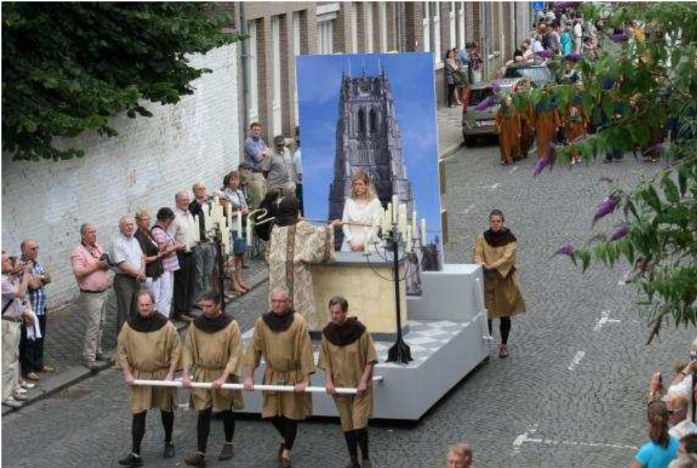
Uitbeelding van gebeurtenissen uit het leven van Sint Servaas.