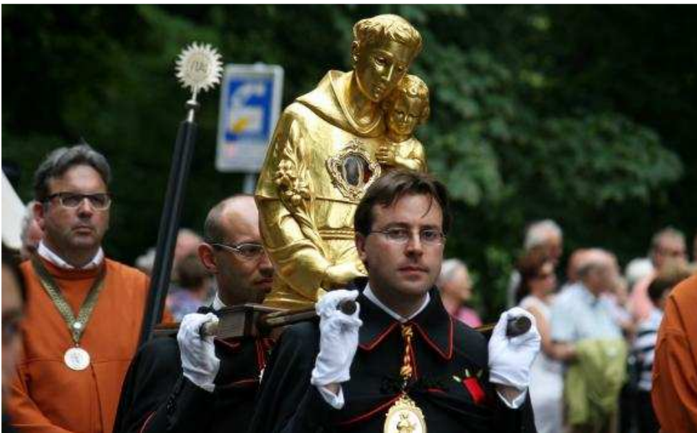
Italiaanse en Nederlandse leden van de aartsbroederschap van Sint Antonius van Padua.