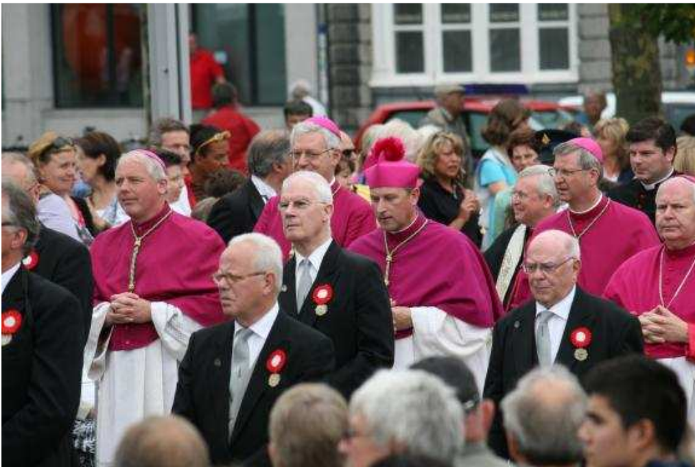
Bisschoppen volgen de Noodkist.