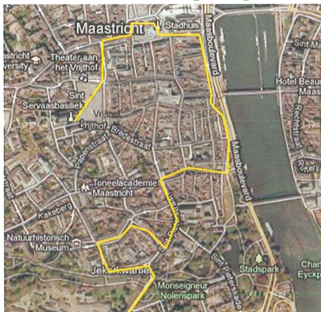
De gele lijn is een weergave van de route van de stoet.

De thema's zijn: De opening, De (chronologische) weergave van de belangrijkste historische feiten van de Kerk in Maastricht, Pelgrims naar Sint Servaas in verleden en heden, Uitbeelding het thema 'Ad Lucem' - 'het Licht tegemoet', De stadsdevoties van