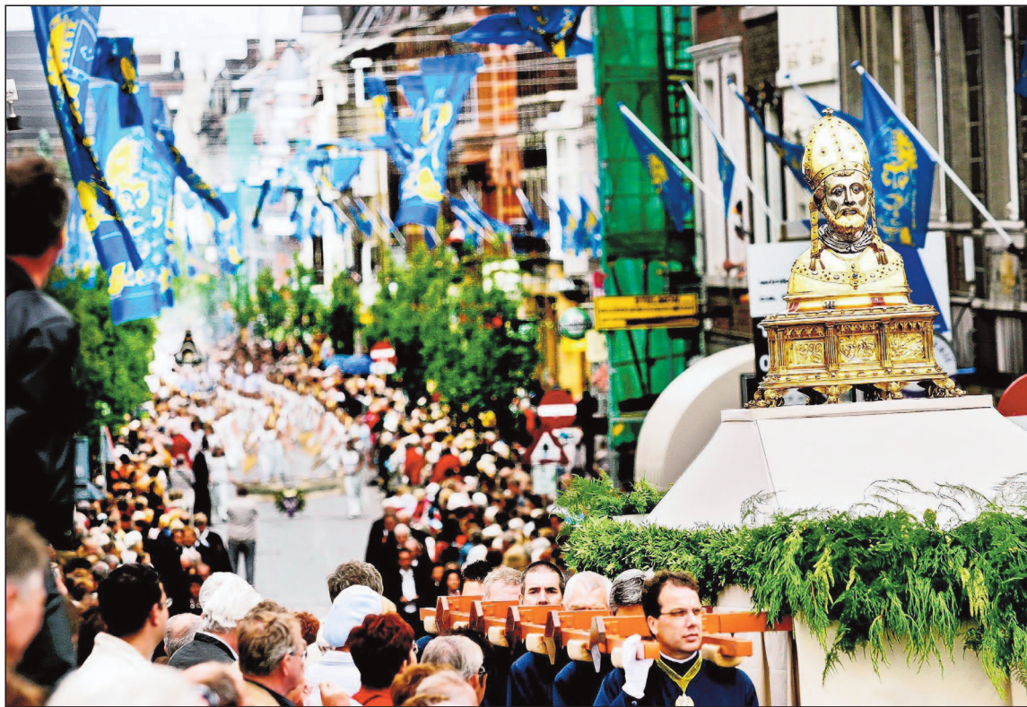
De man waar het tijdens de Heiligdomsvaart allemaal om draait: Sint Servaas. Zijn borstbeeld wordt, net zoals tijdens de ommegang in 2004, door de stad gedragen.