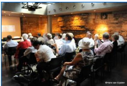
De lezing in het auditorium

In het kader van de Heiligdomsvaart wordt er door historicus Jac van den Boogard de lezing “Maastricht pelgrimsstad-regilieuze stad” gegeven die gevolgd wordt door de rondleiding “Gods Glorie in herbruik”.