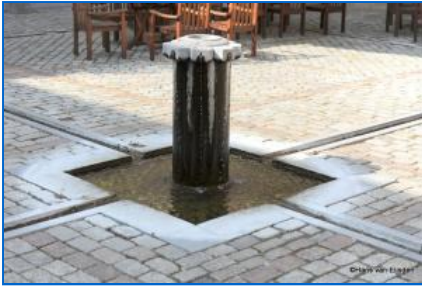
De Fontein der Wijzen

Nog een kleine bezichtiging rest ons en dat is de binnenplaats van het klooster waar de tuin is ontworpen door kunstenaar Marianne Aartsen en waar in het midden een prachtige fontein staat met de naam "Fontein der Wijzen" en waarbij het water komende uit deze fontein uitloopt in alle vier de windrichtingen.