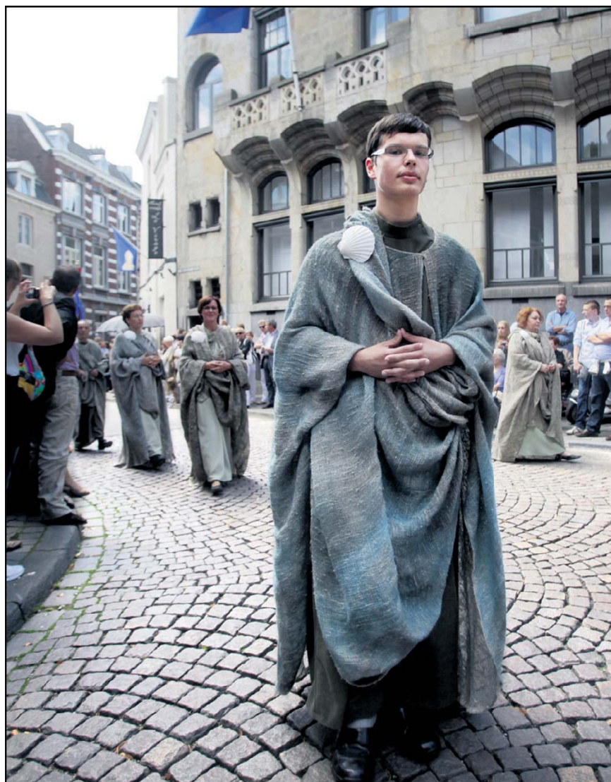
Drie ommegangen: de Heiligdomsvaart in Maastricht, de Virga Jesse-stoet