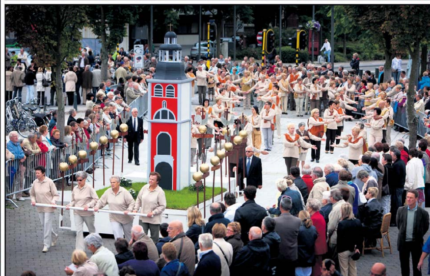
in Hasselt en de Kroningsfeesten in Tongeren: elk stoet heeft zijn eigen karakter