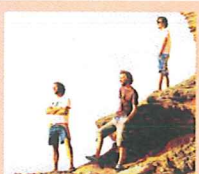
Sungazer presenteert eerste volwaardige album