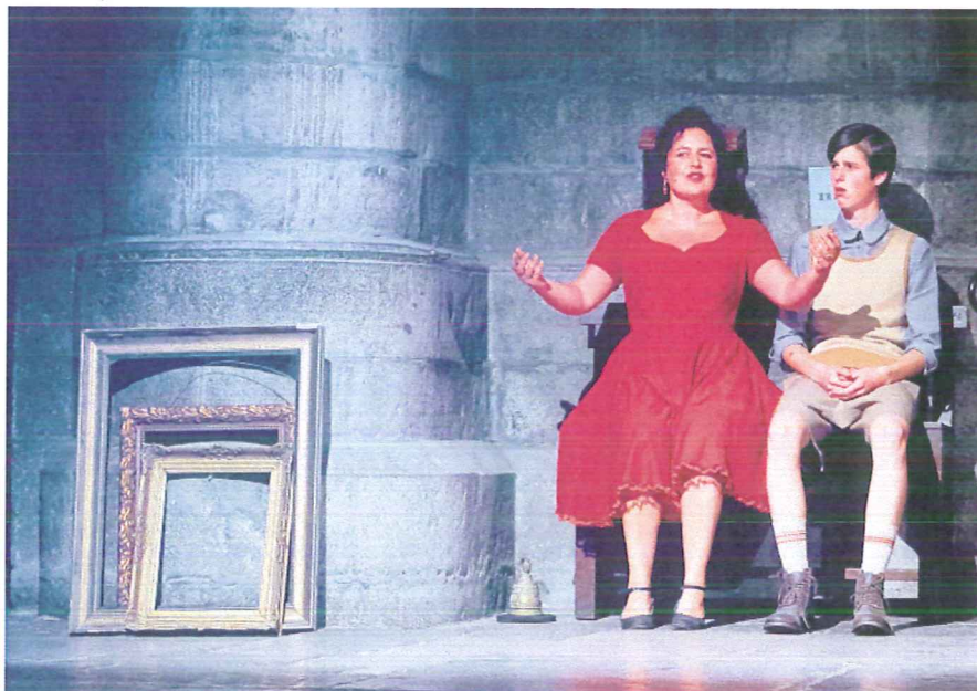
'Licht' in de Sint Janskerk. Het spel wordt nog opgevoerd tot en met 9 juli.