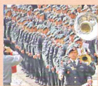
36 man van Nationale Reserve op imposante wijze beëdigd in Maastricht