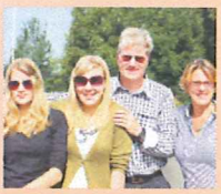
Trompetter/Maaspost zwaait vakantiegangers uit bij de grens