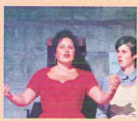
Het spel 'Licht' in Sint Janskerk maakt indruk bij Heiligdomsvaart