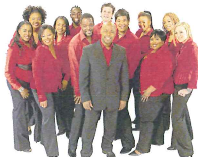
The London Community Gospel Choir