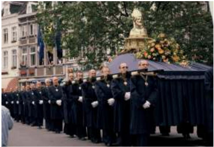
Het borstbeeld van St. Servaas zoals het in de stoet wordt meegedragen wordt.