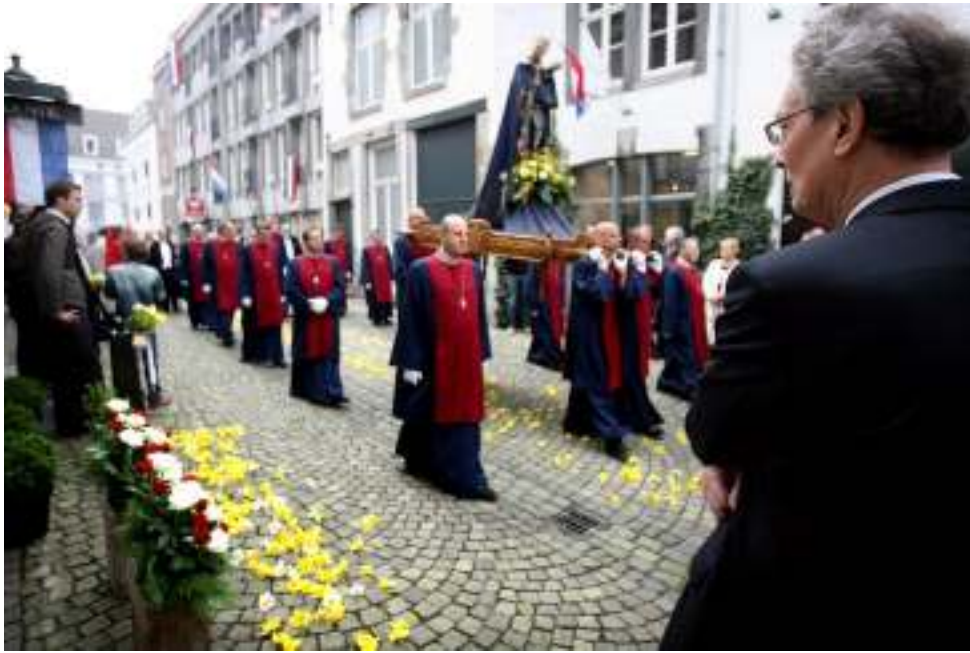
Onze lieve Vrouw Sterre der Zee in de stoet