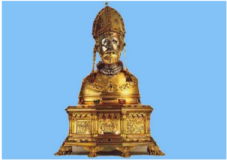
Het borstbeeld van St. Servaas