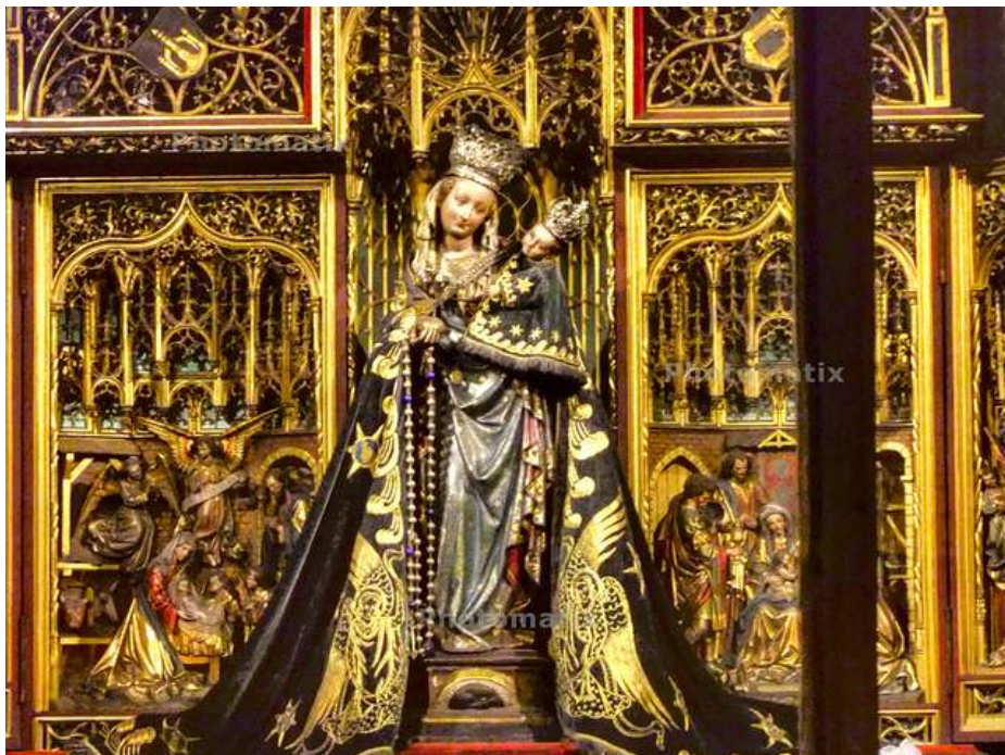
Onze Lieve Vrouw Sterre der Zee