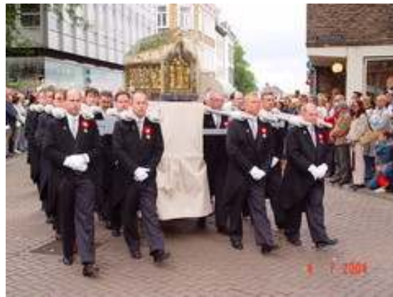
De noodkist in de stoet