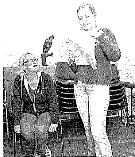
Even snel de tekst doornemen.